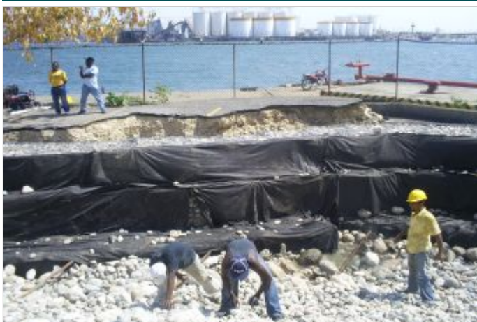
Durante a obra