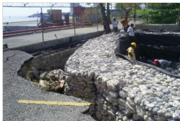
Durante a obra