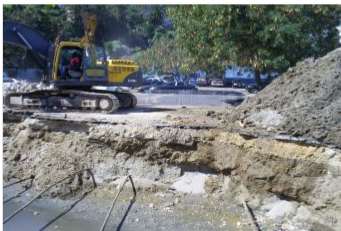
Durante a obra