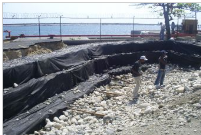
Durante a obra