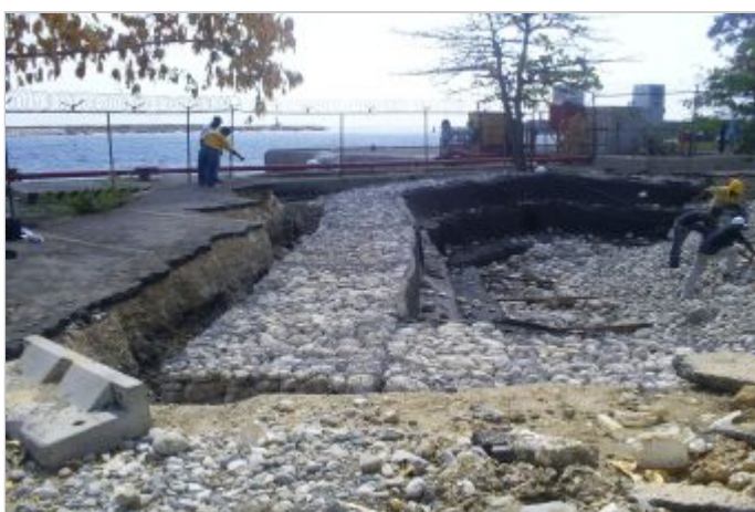
Durante a obra