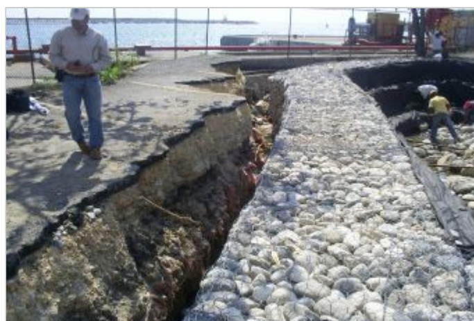
Durante a obra

Seção Tipo (h=4,00m) Ext.: 24,00 Mts. (Verificar Dados) Escala: 1:100