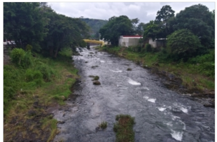
Antes de la Obra

La solución fue determinada por la Comisión Nacional del Agua, en donde Maccaferri tuvo la oportunidad de brindar asesoría técnica para el análisis de estabilidad de un muro gavión en la protección de la curva principal del río en el cadenamiento 0+170, en la parte inferior de la calle El Marqués. La solución general consistió en construir muros de protección marginal con gaviones y para las curvas exteriores se decidió que los muros tuvieran mayor altura debido a que el Río Tepango es un río de montaña. El proyecto requirió la protección de ambas márgenes con muros de gaviones.