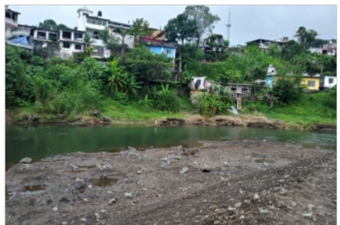
Antes de la Obra