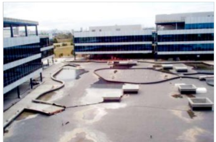
Antes de la Obra