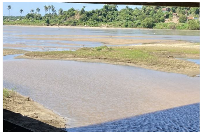
Antes de la Obra