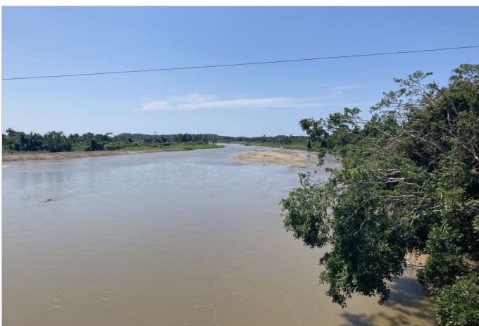
Antes de la Obra