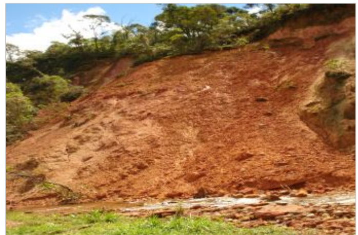
Antes da Obra