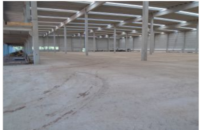
Antes de la Obra

La solución inicialmente analizada se caracterizaba por el uso de las macro fibras sintéticas, donde en el proyecto se estimaba una dosis de 5 kilos de este material para un área de 13.000 m 2 . Con la utilización de las fibras metálicas, se obtuvo un piso con características de desempeño superior al de macro fibra y costo final menor que la solución inicial proyectada y espesor igual a 15 cm.