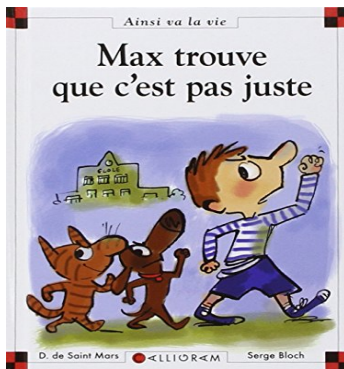
Max trouve que c'est pas juste

Max voit l'injustice partout ! C'est pas juste à la maison d'avoir une grande sœur qui a toujours des bonnes notes et plus de frites ! C'est pas juste à l'école, d'être soupçonné d'avoir copié sur Kim ! Max se sent seul. Comment s'y prendra-t-il pour que la v