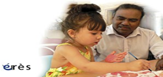
Développement du langage et plurilinguisme chez le jeune enfant

L'objectif central de l'ouvrage est d'analyser les liens très complexes entre développement langagier en contexte multilingue et bien-être des enfants, des familles et des acteurs éducatifs, et d'en saisir les enjeux politiques, idéologiques, &#x