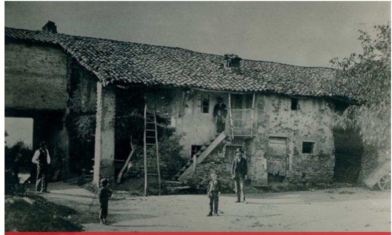
Aldea en donde se crió Don Bosco.

Cierto, Don Bosco no fue más que un medio de comunicación de la voluntad divina, y la mala suerte de la familia real fue una