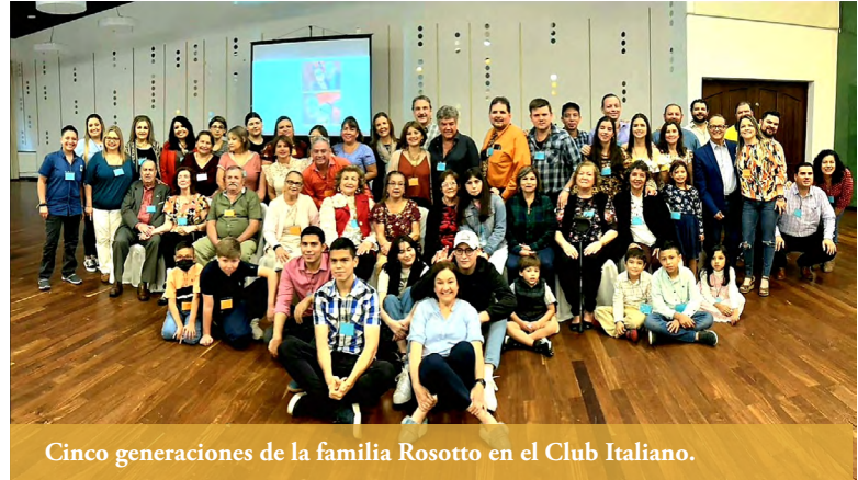
Cinco generaciones de la familia Rosotto en el Club Italiano.