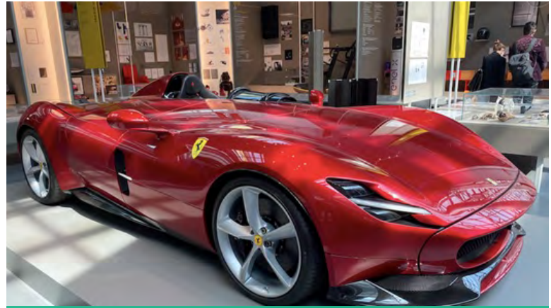
ADI Museo del diseño Compasso d'Oro en Milano

Armani por mencionar algunas; el diseño industrial, con aportes tan trascendentales como la icónica cafetera moka o la máquina de escribir Olivetti, y por supuesto la arquitectura, con importantes aportes a la teoría como los de Bruno Zevi o Aldo Rossi, hasta llegar a los más innovadores paradigmas de la sostenibilidad impulsados por Mario Cucinella y su School of Sustainability SOS, o Stefano Boeri y su Bosco Verticale. Cada uno de los diferentes gremios comparte sus innovadoras propuestas en varios espacios como Il Salone del mobile, La Biennale di Venezia, La Triennale di Milano, los cuales son vitrinas que muestran las últimas tendencias, espacios de discusión y reflexión sobre los nuevos paradigmas en la organización espacial y el diseño de los elementos que integran las composiciones espaciales.