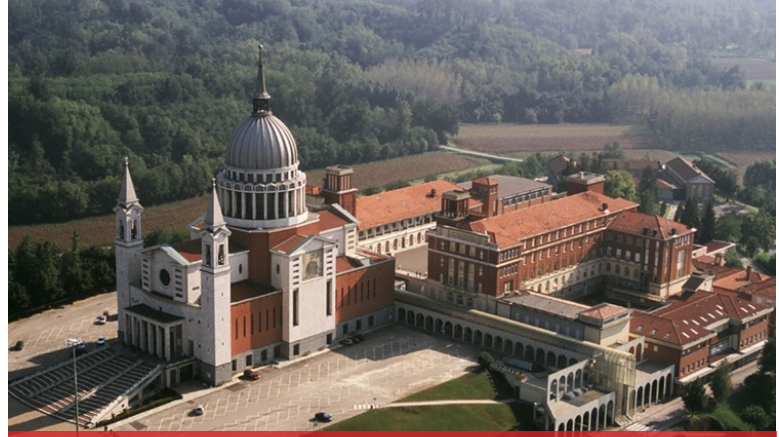
Basílica de Don Bosco, Castelnuovo.

Todos conocemos su compromiso social con los jóvenes: la creación del Oratorio como realización concreta de su “sueño de los nueve años”: «No con golpes, sino la mansedumbre y la caridad deberás ganarte a estos tus amigos.» Al principio fue una experiencia