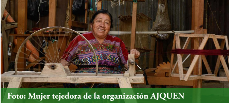
Foto: Mujer tejedora de la organización AJQUEN