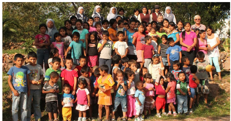
Foto: Niños de la Ciudad de la Felicidad, Esquipulas Tomada de la sección LOS ITALIANOS EN LA VIDA DE GUATEMALA / Iniciativas de voluntariado