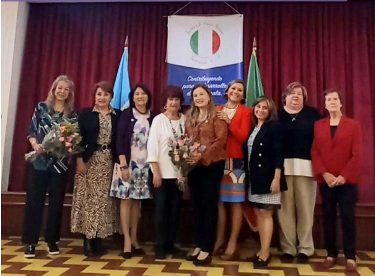
Foto: Integrantes de La Asociación de Damas Italianas

“El amor de una mujer está en sus acciones” - Madre Teresa de Calcuta.