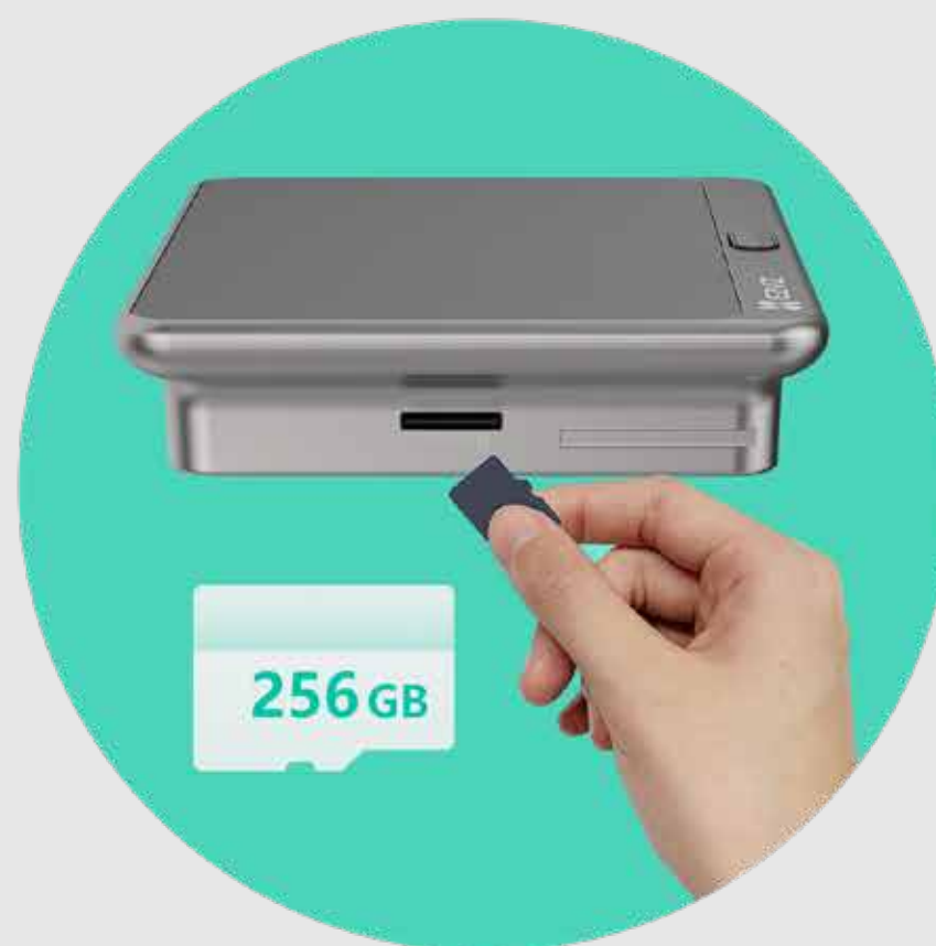
Suporta cartão MicroSD 3

Guarde os vídeos localmente, num cartão de armazenamento de 256 GB que pode ser inserido no monitor interior. Desta forma, garante a segurança dos dados se a câmara exterior for danificada. Ou, se preferir, subscreva a EZVIZ CloudPlay para desfrutar de um armazenamento totalmente encriptado na nuvem.