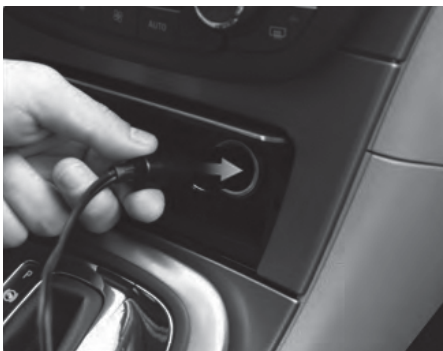
PASSO 1 Conecte o acendedor de 12V na tomada.