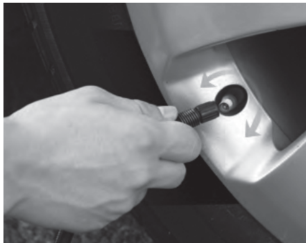
PASSO 2 Enrosque a mangueira de ar na haste da válvula do pneu.