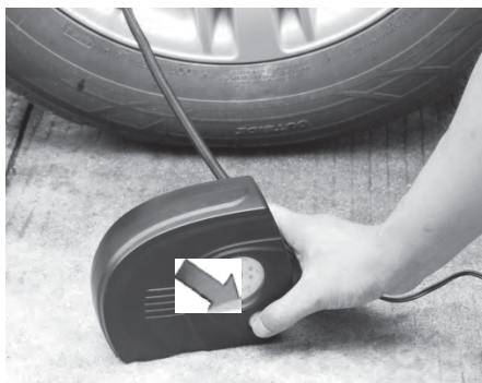
PASSO 4 Pressione o interruptor de acionamento (ON/OFF) para desligar o compressor quando atingir a pressão recomendada.