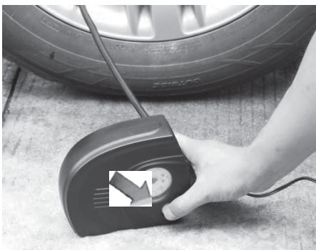
PASSO 3 Pressione o interruptor de acionamento (ON/OFF) para fazer funcionar o motor. Fique atento ao manômetro.