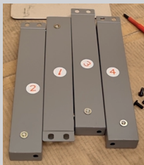
IMAGEN DE LOS RIELES REALES QUE TRAEN LA PARRILLA

C21 Riel del Carro derecho, abajo y adelante. “Riel N°3” esta debe tener perforación en el lado derecho superior para ubicar la puerta y que esta se abra hacia la derecha. (Punto rojo donde debe ir la perforación).