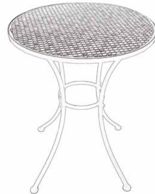
IMAGEN/IMAGEM MERAMENTE ILUSTRATIVA

Por cualquier reclamo o desperfecto diríjase a la tienda Sodimac donde adquirió el producto junto con su comprobante de compra, nuestro servicio de post venta lo asistirá con gusto.