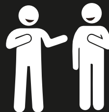
Personas para armado Pessoas para a montagem