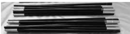
Varillas de fibra de vidrio x 2 piezas. (A) con una marca roja Varetas de fibra de vidro x 2 peças. (A) com uma marca vermelha