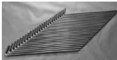
Estacas de la carpa 26 piezas Estacas da barraca 26 peças.