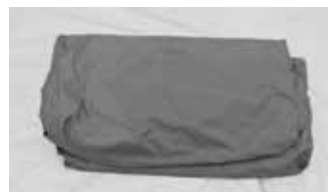
Carpa interior Barraca interior