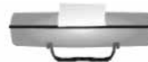
Bolsa de transporte Bolsa para transporte