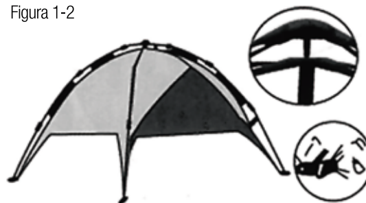
Dispositivo hidráulico de la sombrilla Dispositivo hidráulico da sombrinha Estacas para fijación al suelo Espeques para fixação ao solo

2. Asegúrese de que todos los conectores de la carpa estén correctamente posicionados. Al levantar la parte superior de la carpa, el dispositivo hidráulico se abrirá automáticamente y se fijará a la estructura de varillas. La estructura externa se puede usar en la playa o para fines de pesca.