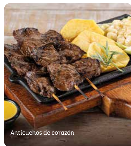
Anticuchos de corazón

*Todas las parrillas vienen acompañadas de ensalada parrillera y papas fritas.