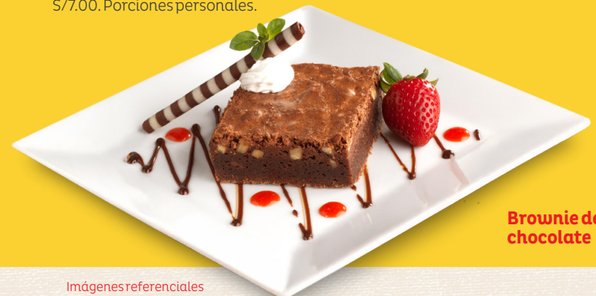
Brownie de chocolate

*Agregue una bola de helado por S/7.00. Porciones personales.