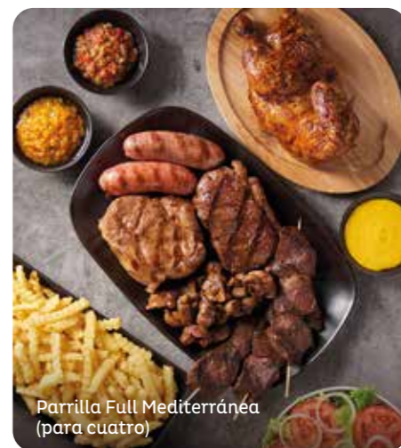
Parrilla Full Mediterránea (para cuatro)