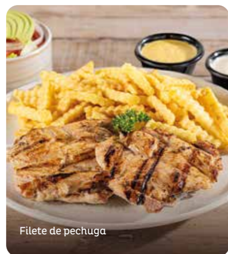
Filete de pechuga