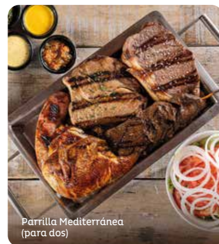
Parrilla Mediterránea (para dos)