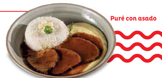
Puré con asado