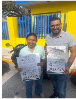
CASITA AMARILLA, ISLA MUJERES