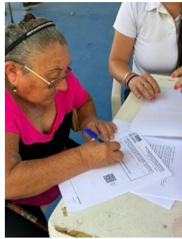
FEDHAM FEDERACIÓN ESTATAL PARA EL DESARROLLO HUMANO DE LOS ADULTOS MAYORES EN QUINTANA ROO, BENITO JUÁREZ