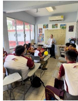
CBTIS No. 28 JOSÉ VASCONCELOS, COZUMEL