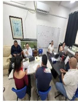
REUNIÓN CAM EDUARD HUET. ACERCAMIENTO Y ASESORÍA PARA INSCRIBIR A PROFESORES, BENITO JUÁREZ