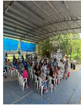
FEDHAM FEDERACIÓN ESTATAL PARA EL DESARROLLO HUMANO DE LOS ADULTOS MAYORES EN QUINTANA ROO, BENITO JUÁREZ