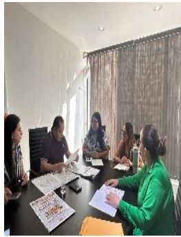
REUNIÓN DE CAPACITACIÓN DE PERSONAL DE LA REPRESENTACIÓN ZONA NORTE PODER LEGISLATIVO, BENITO JUÁREZ