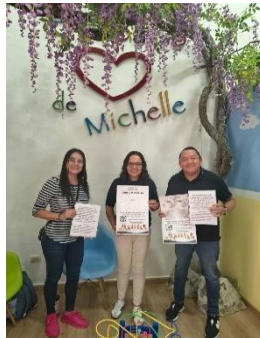
EL ESPACIO DE MICHELLE, CENTRO DE EDUCACIÓN ESPECIAL, BENITO JUÁREZ