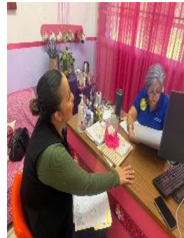
CENTRO DE ATENCIÓN MÚLTIPLE ROBERTO SOLÍS QUIROGA CENTRO DE EDUCACIÓN ESPECIAL, OTHÓN P. BLANCO