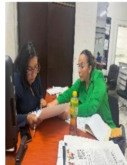
TITULAR DE LA DIRECCIÓN DE INCLUSIÓN DEL MUNICIPIO DE BENITO JUÁREZ