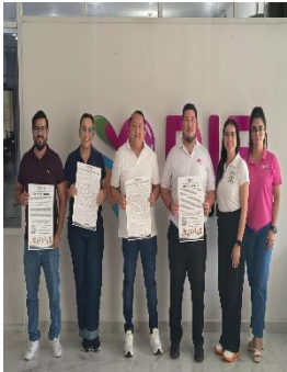
DIF. MUNICIPIO DE COZUMEL