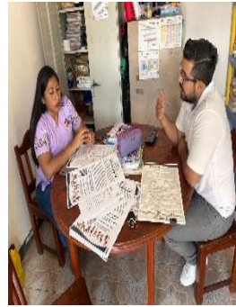
CAM FELIPE CARRILLO PUERTO, FELIPE CARRILLO PUERTO