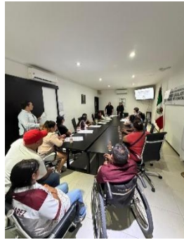
REUNIÓN CON ASOCIACIÓN DE SORDOS DE ANA MARÍA OFICINAS DE REPRESENTACIÓN ZONA NORTE, BENITO JUÁREZ