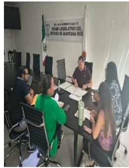
REUNIÓN DE CAPACITACIÓN DEL PERSONAL DEL PODER LEGISLATIVO ZONA NORTE BENITO JUÁREZ