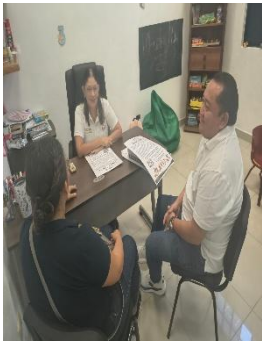
CENTRO DE REHABILITACIÓN INTEGRAL. CRIM, COZUMEL