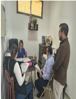
CENTRO DE REHABILITACIÓN INTEGRAL (CRIM), FELIPE CARRILLO PUERTO