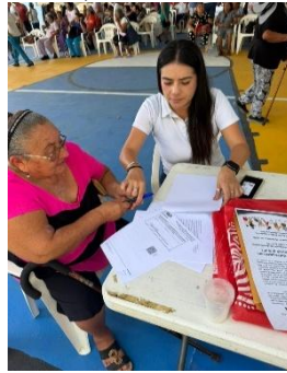
FEDHAM FEDERACIÓN ESTATAL PARA EL DESARROLLO HUMANO DE LOS ADULTOS MAYORES EN QUINTANA ROO, BENITO JUÁREZ