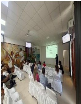
DIRECCIÓN PARA LA INCLUSIÓN DE LAS PERSONAS CON DISCAPACIDAD H. AYUNTAMIENTO DE BENITO JUÁREZ