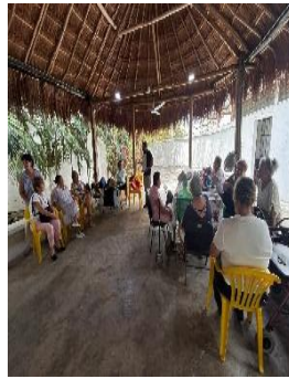
IMPULSANDO VOLUNTADES A.C., BENITO JUÁREZ