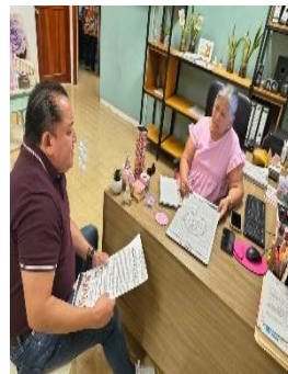
CAM LABORAL OXTANKA, PLAYA DEL CARMEN