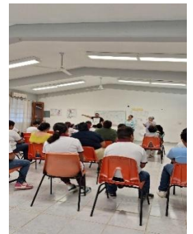
CAM LABORAL ROBERTO SOLÍS QUIROGA, OTHÓN P. BLANCO