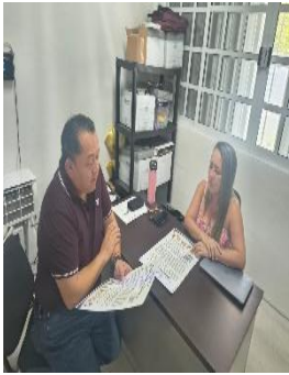
CAM. JEAN PIAGET, PLAYA DEL CARMEN