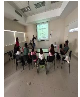
UNIVERSIDAD DEL CARIBE, BENITO JUÁREZ