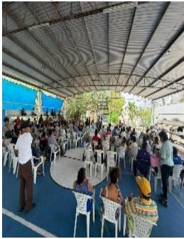
FEDHAM FEDERACIÓN ESTATAL PARA EL DESARROLLO HUMANO DE LOS ADULTOS MAYORES EN QUINTANA ROO, BENITO JUÁREZ