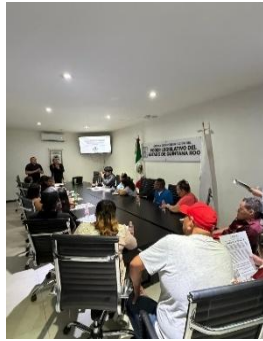
REUNIÓN CON ASOCIACIÓN DE SORDOS DE ANA MARÍA OFICINAS DE REPRESENTACIÓN ZONA NORTE, BENITO JUÁREZ