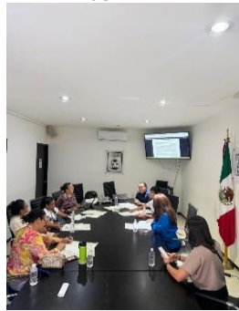
REUNIÓN CON INTEGRANTES DEL PRIMER PARLAMENTO DE LA INCLUSIÓN DEL ESTADO DE QUINTANA ROO, BENITO JUÁREZ