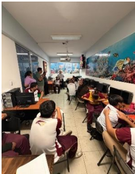
CBTIS No. 28 JOSÉ VASCONCELOS, COZUMEL