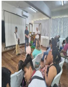
CENTRO DE ATENCIÓN MÚLTIPLE (CAM) EDUARDO HUET T.V., BENITO JUÁREZ