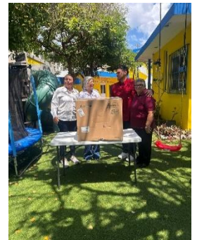
AMOR A LA NIÑEZ A.C. CENTRO DE APOYO PSICOPEDAGOGICO, ISLA MUJERES