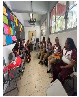
CBTIS No. 28 JOSÉ VASCONCELOS, COZUMEL