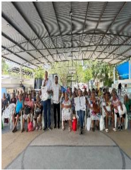
FEDHAM FEDERACIÓN ESTATAL PARA EL DESARROLLO HUMANO DE LOS ADULTOS MAYORES EN QUINTANA ROO, BENITO JUÁREZ