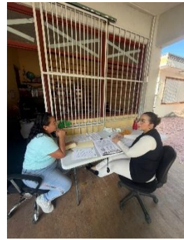
CAM TUUMBEN KUXTAL, FELIPE CARRILLO PUERTO