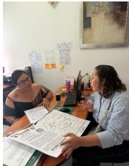
DIF MUNICIPAL DE BENITO JUÁREZ