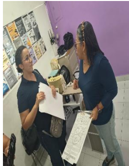
DIRECCIÓN DE CULTURA MUNICIPIO DE COZUMEL