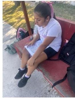
ASOCIACIÓN DE DEPORTE ADAPTADO, FELIPE CARRILLO PUERTO