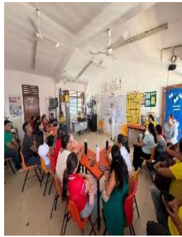
CAM MIGUEL HIDALGO Y COSTILLA, JOSÉ MARÍA MORELOS