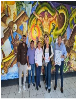
XHNKA LA VOZ DEL GRAN PUEBLO, FELIPE CARRILLO PUERTO