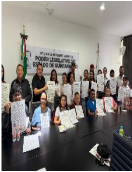
REUNIÓN CON ASOCIACIÓN DE SORDOS DE ANA MARÍA OFICINAS DE REPRESENTACIÓN ZONA NORTE, BENITO JUÁREZ