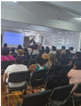
MARGARITA GÓMEZ PALACIO M. CENTRO DE EDUCACIÓN ESPECIAL, BENITO JUÁREZ