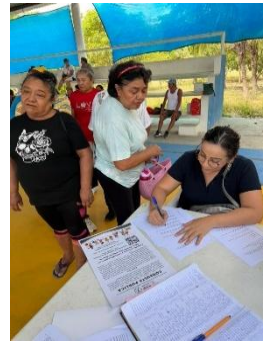
FEDHAM FEDERACIÓN ESTATAL PARA EL DESARROLLO HUMANO DE LOS ADULTOS MAYORES EN QUINTANA ROO, BENITO JUÁREZ