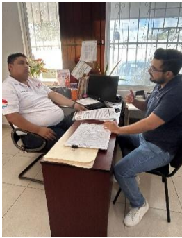
CENTRO DE REHABILITACIÓN INTEGRAL (CRIM), BENITO JUÁREZ