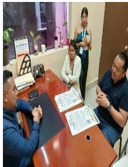
SECRETARÍA DE JUSTICIA SOCIAL Y PARTICIPACIÓN CIUDADANA, PLAYADELCARMEN