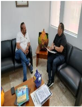
FUNDACIÓN TELETON, BENITO JUÁREZ, QUINTANA ROO