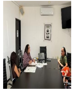
REUNIÓN CON INTEGRANTES DEL PRIMER PARLAMENTO DE LA INCLUSIÓN OFICINAS DE REPRESENTACIÓN ZONA NORTE, BENITO JUÁREZ