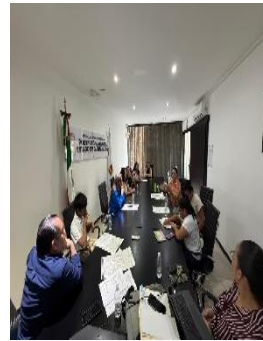
REUNIÓN CON INTEGRANTES DEL PRIMER PARLAMENTO DE LA INCLUSIÓN DEL ESTADO DE QUINTANA ROO, BENITO JUÁREZ