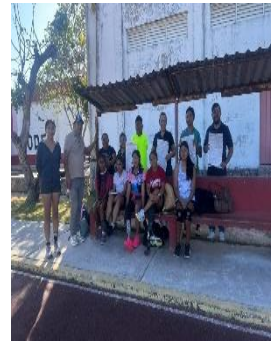
ASOCIACIÓN DE DEPORTE ADAPTADO, FELIPE CARRILLO PUERTO