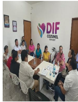
DIF. MUNICIPIO DE COZUMEL