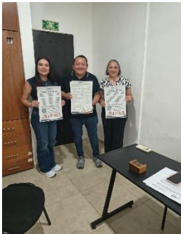
ASOCIACIÓN A.C. LUNA, BENITO JUÁREZ