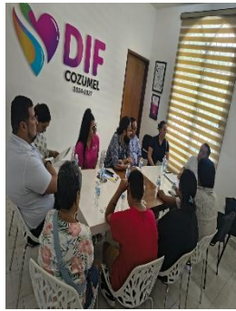
DIF. MUNICIPIO DE COZUMEL