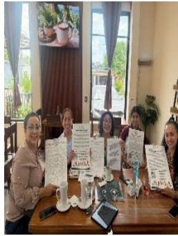
ASOCIACIÓN LA FUERZA DEL CORAZÓN FELIPE CARRILLO PUERTO Y FUNDACIÓN CASITA CORAZÓN, FELIPE CARRILLO PUERTO