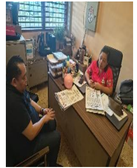
CAM TUUMBEN KUXTAL, FELIPE CARRILLO PUERTO