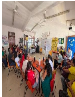
USAER JOSÉ MARÍA MORELOS Y EDUCACIÓN ESPECIAL, PREESCOLAR, PRIMARIA Y SECUNDARIA