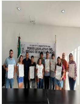
ASOCIACIÓN DE SORDOS AC EN LA REPRESENTACIÓN DE LA ZONA NORTE, BENITO JUÁREZ