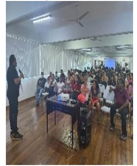
MARGARITA GÓMEZ PALACIO M. CENTRO DE EDUCACIÓN ESPECIAL, BENITO JUÁREZ