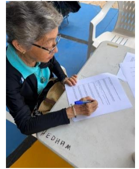
FEDHAM FEDERACIÓN ESTATAL PARA EL DESARROLLO HUMANO DE LOS ADULTOS MAYORES EN QUINTANA ROO, BENITO JUÁREZ