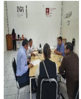
XHNKA LA VOZ DEL GRAN PUEBLO, FELIPE CARRILLO PUERTO