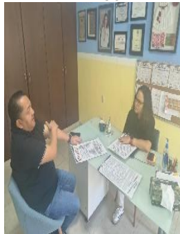
EL ESPACIO DE MICHELLE, CENTRO DE EDUCACIÓN ESPECIAL, BENITO JUÁREZ