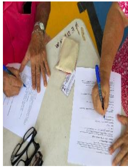
FEDHAM FEDERACIÓN ESTATAL PARA EL DESARROLLO HUMANO DE LOS ADULTOS MAYORES EN QUINTANA ROO, BENITO JUÁREZ