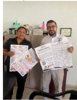
FUNDACIÓN PRO - SÍNDROME DE DOWN DE CANCÚN A. C., BENITO JUÁREZ