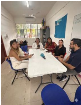
REUNIÓN KOOX AUTISMO AC, BENITO JUÁREZ