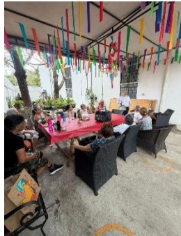
CLUB DE LOS AÑOS DORADOS, BENITO JUÁREZ