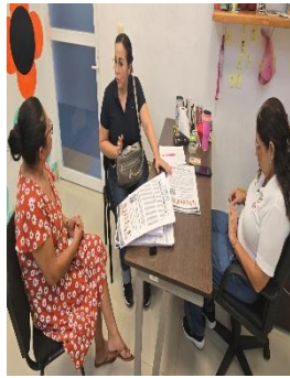
CENTRO DE REHABILITACIÓN INTEGRAL. CRIM, COZUMEL