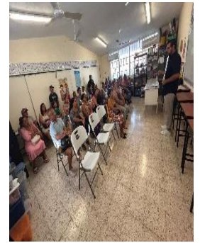
CAM CULTURA MAYA CANCÚN MUNICIPIO DE BENITO JUÁREZ