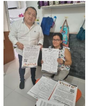
ESCUELA. MAPACHE 51, PLAYA DEL CARMEN