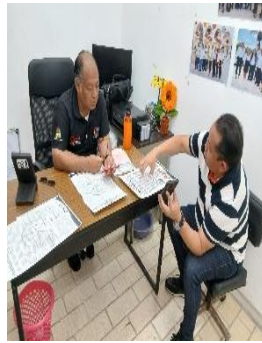
CAM MIGUEL HIDALGO Y COSTILLA, JOSÉ MARÍA MORELOS