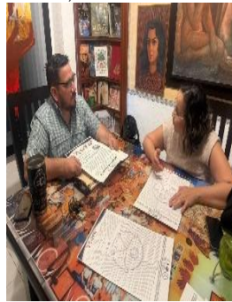
FUNDACION ELIO CARMICHAEL, OTHÓN P. BLANCO