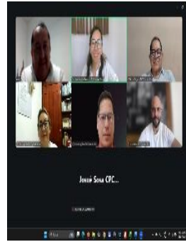
REUNIÓN CON EL CPC DE QUINTANA ROO