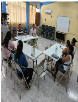
CAM GONZALO GUERRERO, MUNICIPIO BENITO JUÁREZ, QUINTANA ROO