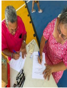
FEDHAM FEDERACIÓN ESTATAL PARA EL DESARROLLO HUMANO DE LOS ADULTOS MAYORES EN QUINTANA ROO, BENITO JUÁREZ