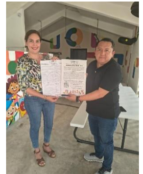
CENTRO DE DESARROLLO PILARES, TULUM