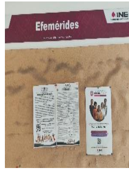
INE QUINTANA ROO