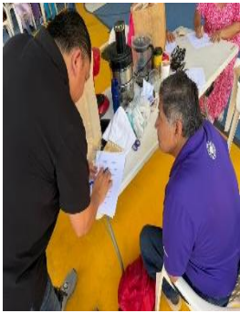
FEDHAM FEDERACIÓN ESTATAL PARA EL DESARROLLO HUMANO DE LOS ADULTOS MAYORES EN QUINTANA ROO, BENITO JUÁREZ