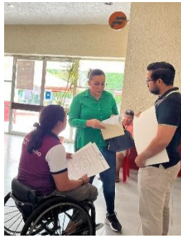
GRUPO DE DANZA EN SILLA DE RUEDAS, BENITO JUÁREZ