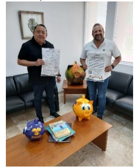
FUNDACIÓN TELETON, BENITO JUÁREZ, QUINTANA ROO