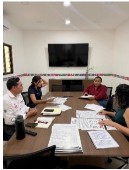
CENTRO DE REHABILITACIÓN INTEGRAL (CRIM), ISLA MUJERES