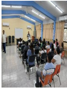
CAM ALBERT EINSTEIN, BENITO JUÁREZ