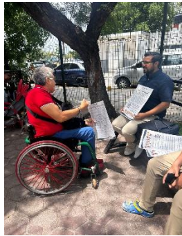
ASOCIACIÓN LIBERTAD Y SUPERACIÓN SOBRE RUEDAS A.C MUNICIPIO DE BENITO JUÁREZ