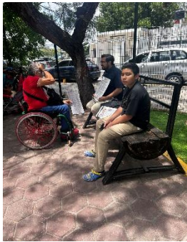
ASOCIACIÓN LIBERTAD Y SUPERACIÓN SOBRE RUEDAS A.C MUNICIPIO DE BENITO JUÁREZ