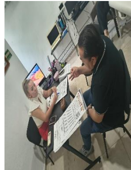
ASOCIACIÓN A.C. LUNA, BENITO JUÁREZ