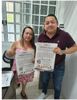
CAM. JEAN PIAGET, PLAYA DEL CARMEN