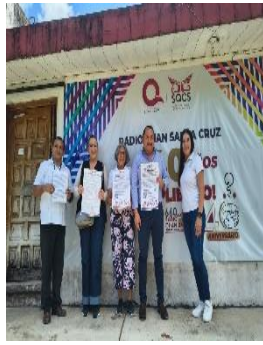
RADIO CHAN SANTA CRUZ FELIPE, CARRILLO PUERTO