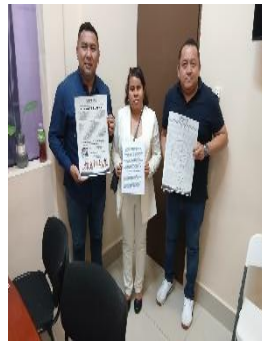
SECRETARÍA DE JUSTICIA SOCIAL Y PARTICIPACIÓN CIUDADANA, PLAYA DEL CARMEN