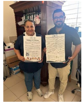
CENTRO DE AUTISMO, BENITO JUÁREZ