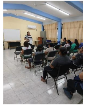
CAM ALBERT EINSTEIN BENITO JUÁREZ