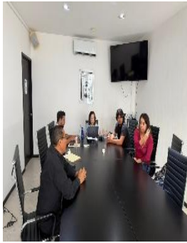
ASOCIACIÓN DE SORDOS A.C. DEL ESTADO DE QUINTANA ROO, BENITO JUÁREZ