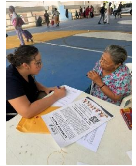
FEDHAM FEDERACIÓN ESTATAL PARA EL DESARROLLO HUMANO DE LOS ADULTOS MAYORES EN QUINTANA ROO, BENITO JUÁREZ