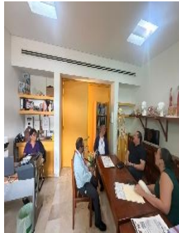
CENTRO DE REHABILITACIÓN INTEGRAL DE QUINTANA ROO (CRIQ), OTHÓN P. BLANCO