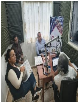
RADIO CHAN SANTA CRUZ, FELIPE CARRILLO PUERTO