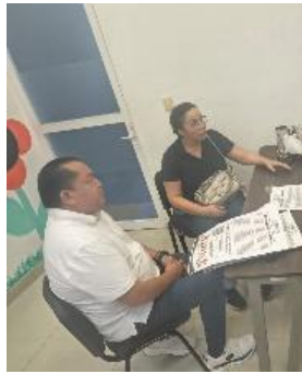
CENTRO DE REHABILITACIÓN INTEGRAL (CRIM), COZUMEL