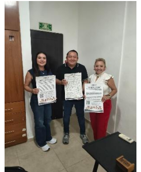
ASOCIACIÓN A.C. LUNA, BENITO JUÁREZ