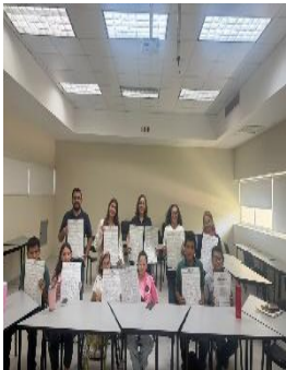
UNIVERSIDAD DEL CARIBE, BENITO JUÁREZ