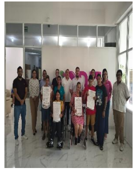
DIF. MUNICIPIO DE COZUMEL