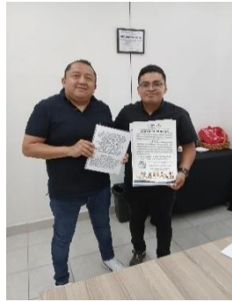
INSTITUTO DE LA JUVENTUD, PLAYA DEL CARMEN