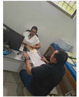
CENTRO DE REHABILITACIÓN INTEGRAL (CRIM), TULUM