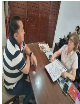
PRO NIÑOS EXCEPCIONALES ASOCIACIÓN CIVIL, BENITO JUÁREZ