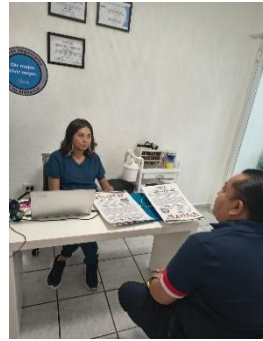
CAM ALBERT EINSTEIN, BENITO JUÁREZ