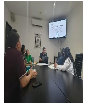
REUNIÓN KOOX AUTISMO A.C. Y EL COORDINADOR DE DEPORTE ADAPTADO DEL INSTITUTO DE LA CULTURA FÍSICA Y DEPORTE, BENITO JUÁREZ