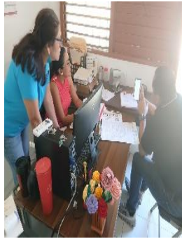
CAM ELVIA CARRILLO PUERTO INTERVENCIÓN TEMPRANA, BENITO JUÁREZ