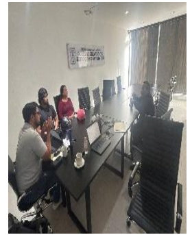
INSCRIPCIÓN DE ASOCIACIÓN DE SORDOS EN LA OFICINA DE REPRESENTACIÓN ZONA NORTE, BENITO JUÁREZ