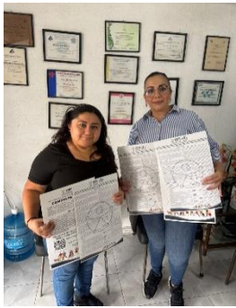
APAFHDEM JÓVENES CON DISCAPACIDAD INTELLECTUAL, BENITO JUÁREZ