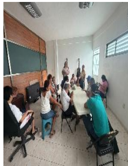
A.C. DE CIEGOS, OTHÓN P. BLANCO