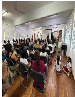
CENTRO DE ATENCIÓN MÚLTIPLE (CAM) EDUARDO HUET T.V., BENITO JUÁREZ