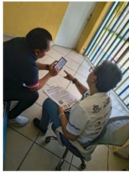
ASOCIACIÓN CENTRO DE ATENCIÓN INTEGRAL, PLAYA DEL CARMEN