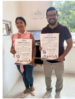
CENTRO DE REHABILITACIÓN INTEGRAL (CRIM), JOSÉ MARÍA MORELOS