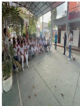
CAM LABORAL LOUIS BRAILLE ESCUELA VOCACIONAL, BENITO JUÁREZ