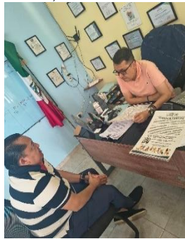
FUNDACIÓN CENT ESCUELA DE EDUCACIÓN ESPECIAL EN BONFIL, BENITO JUÁREZ