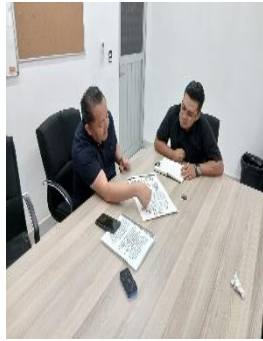
INSTITUTO DE LA JUVENTUD, PLAYA DEL CARMEN