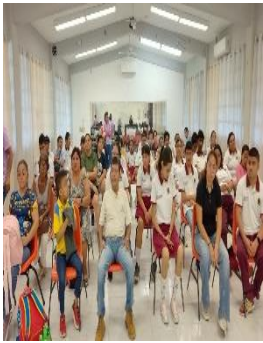
CAM LABORAL ROBERTO SOLÍS QUIROGA, OTHÓN P. BLANCO