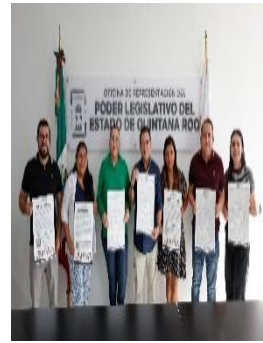
REUNIÓN KOOX AUTISMO A.C. Y EL COORDINADOR DE DEPORTE ADAPTADO DEL INSTITUTO DE LA CULTURA FÍSICA Y DEPORTE, BENITO JUÁREZ