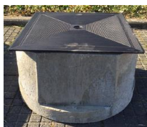
Gietijzeren deksel A15kN