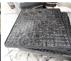
Gietijzeren deksel B125kN