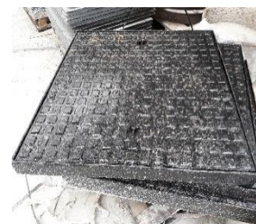
Gietijzeren deksel B125kN