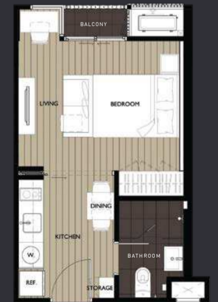
UNIT TYPE A1 1-Bedroom Suite 26.5-30.5 sq. m.