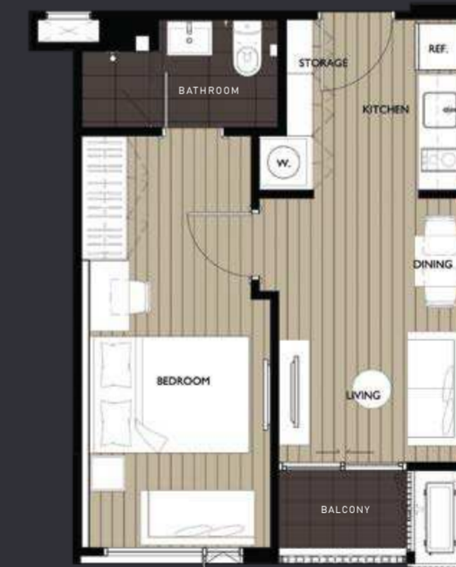
UNIT TYPE A4 1-Bedroom 35.0 sq. m.