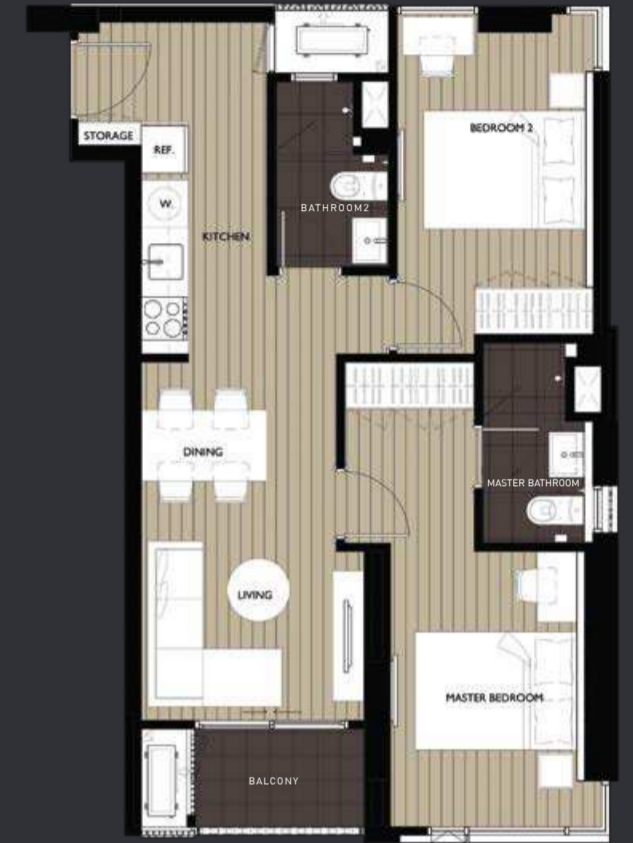
UNIT TYPE B2 2-Bedroom 59.5 sq. m.