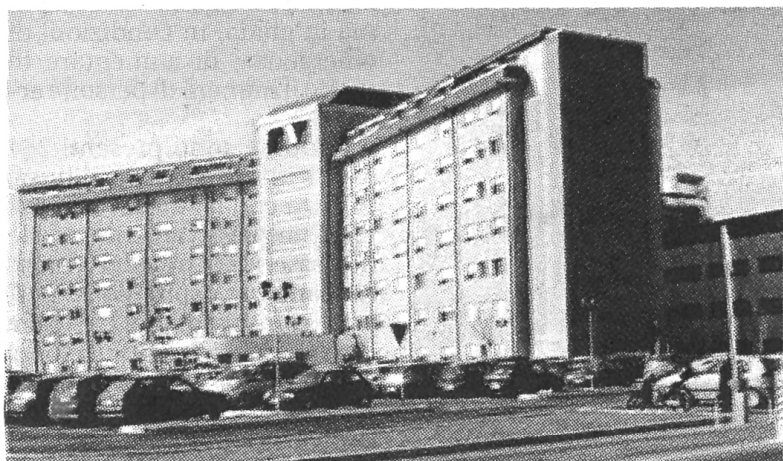
Vittoria in tribunale per i medici di pronto soccorso dell'ospedale di Gorizia

Sentenza del tribunale di Gorizia: accolto il ricorso sul lavoro di sei specialisti Professionista obbligatorio anche nelle strutture di rete, da Palmanova a Latisana