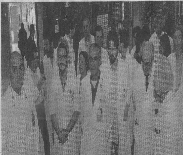
I medici che hanno partecipato al sit in nell'atrio dell'ospedale ieri e la raccolta di firme avviata dall'Intersindacale