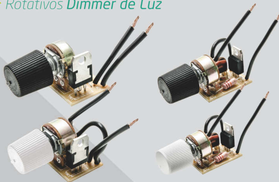
Dimmer Rotativo SEM OFF - Bivolt