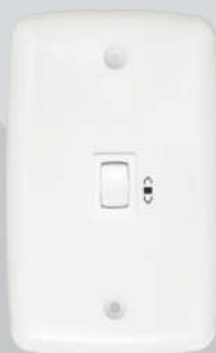
Cód. 05-01 Chave para Exaustor 5A - Bivolt Espelho (4x2)