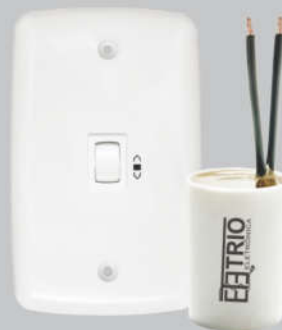
Cód. 06-01 Chave para Exaustor 5A - 127V Espelho (4x2) Capacitor 10uf x 250Vac