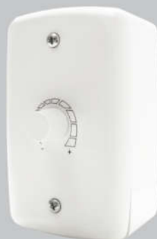
Cód. 02-06 Chave Rotativa c/ OFF 400W - Bivolt Espelho (4x2) Caixa Externa