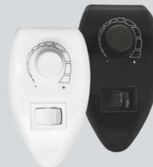
Cód. 02-03 Chave Rotativa Mouse Branco de sobrepor 400W - Bivolt