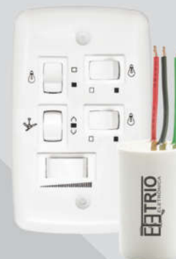
Chave Capacitiva 220V 3 velocidades 3 lâmpadas