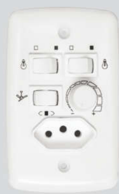
Cód. 01-06 Chave Rotativa 400W - Bivolt Espelho (4x2) 2 lâmpadas isoladas Tomada embutida