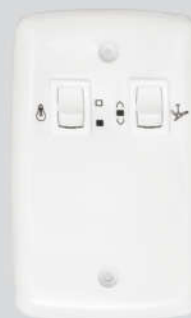
Cód. 05-03 Chave para Exaustor 5A - Bivolt Espelho (4x2) 1 lâmpada