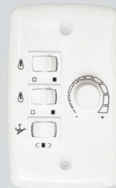
Cód. 01-03 Chave Rotativa 400W - Bivolt 2 lâmpadas isoladas