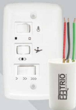
Chave Capacitiva 220V 3 velocidades