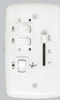
Cód. 04-02 Chave Deslizante 400W - Bivolt Espelho (4x2) 2 lâmpadas