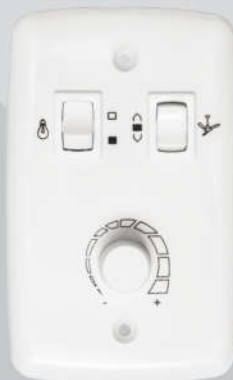
Cód. 01-01 Chave Rotativa 400W - Bivolt Espelho (4x2)