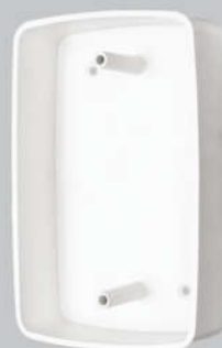
Cód. 11-01 Caixa de Passagem Canto Redondo Branca Fundo Baixo