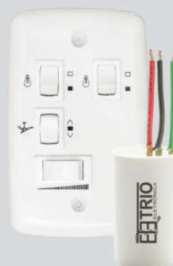
Chave Capacitiva 127V 3 velocidades 2 lâmpadas