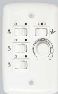
Cód. 01-04 Chave Rotativa 400W - Bivolt Espelho (4x2) 3 lâmpadas isoladas