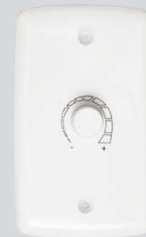
Cód. 02-05 Chave Rotativa c/ OFF 400W - Bivolt Espelho (4x2)