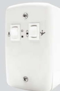
Cód. 05-04 Chave para Exaustor 5A - Bivolt Espelho (4x2) 1 lâmpada Caixa Externa