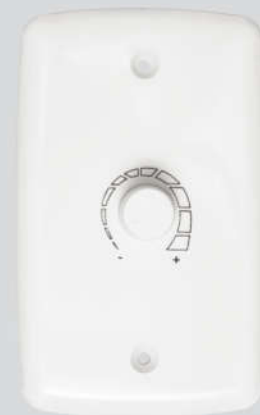
Dimmer Rotativo COM OFF - Bivolt