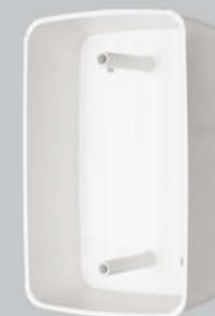
Cód. 11-02 Caixa de Passagem Canto Redondo Branca Fundo Alto