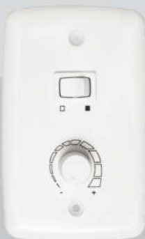
Cód. 02-01 Chave Rotativa 400W - Bivolt Espelho (4x2)