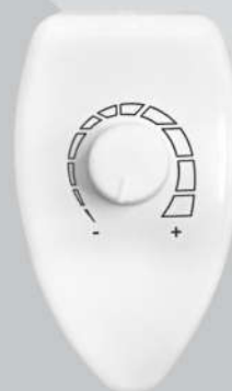
Cód. 02-07 Chave Rotativa com OFF Mouse Branco de sobrepor 400W - Bivolt