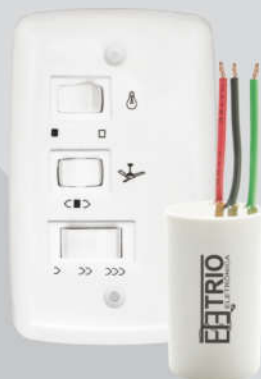
Chave Capacitiva 127V 3 velocidades