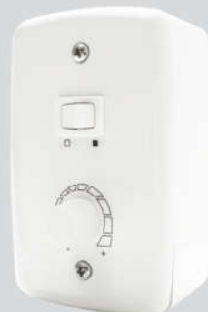
Cód. 02-02 Chave Rotativa 400W - Bivolt Espelho (4x2) Caixa Externa