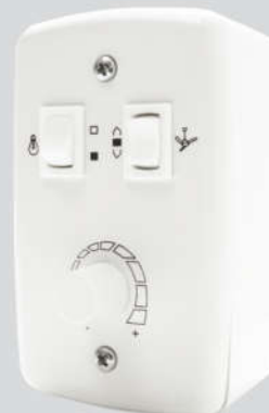
Cód. 01-02 Chave Rotativa 400W - Bivolt Espelho (4x2) Caixa Externa