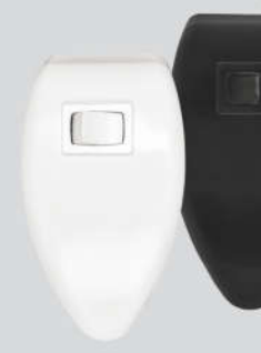
Cód. 05-05 Chave para Exaustor 5A - Bivolt Mouse Branco de Sobre