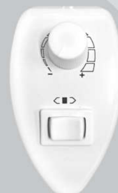
Cód. 01-08 Chave Rotativa 400W - Bivolt Ventilador comercial Mouse branco de sobrepor