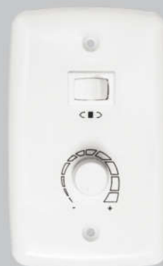
Cód. 01-07 Chave Rotativa 400W - Bivolt Ventilador comercial