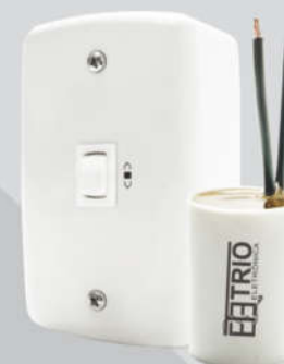
Cód. 06-02 Chave para Exaustor 5A - 127V Espelho (4x2) Capacitor 10uf x 250Vac Caixa Externa