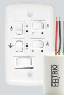
Chave Capacitiva 127V 3 velocidades 3 lâmpadas