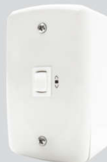
Cód. 05-02 Chave para Exaustor 5A - Bivolt Espelho (4x2) Caixa Externa