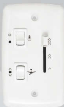
Cód. 04-01 Chave Deslizante 400W - Bivolt Espelho (4x2)