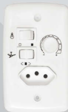
Cód. 01-05 Chave Rotativa 400W - Bivolt Espelho (4x2) Tomada embutida