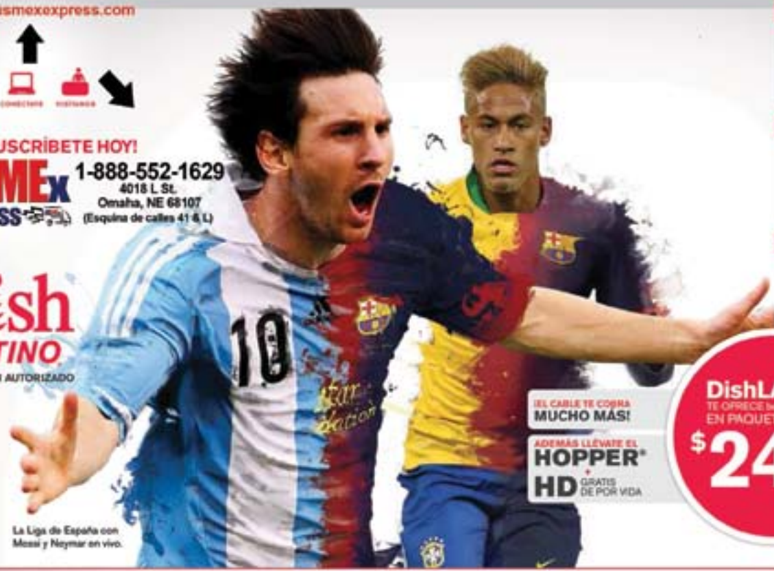
La Liga de España con Messi y Neymar en vivo.