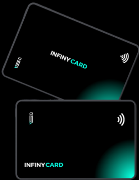
Infiny Card Sin tu diseño