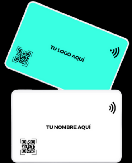
Infiny Card Con tu diseño