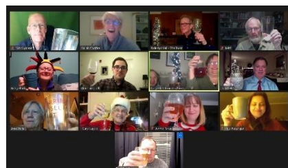
Fête de Concord Toastmasters - lever son verre à la camaraderie du club!