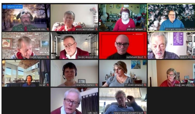
Membres de Toast of the Coast et invités