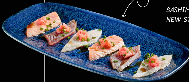
SASHIMI NEW STYLE

SASHIMI NEW STYLE (6 PZ) +€1,00 | +€1,00 alla carta € 5,50 Carpaccio di salmone, tonno e pesce spada scottati con salsa di ponzu e yuzu, guarnito con zenzero ed erba cipollina [209]