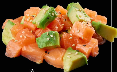
SAKE TARTARE & AVOCADO