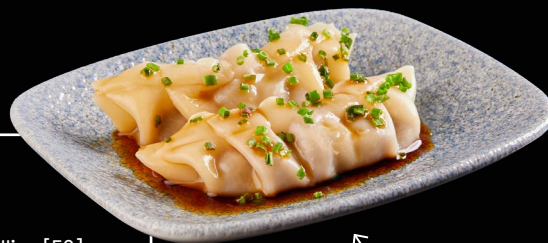
DUMPLING DI POLLO E FUNGHI

DUMPLING POLLO E FUNGHI (2 PZ) ● | ● alla carta € 3,00 Ravioli al vapore con ripieno di pollo e funghi orientali, salsa di soia ed erba cipollina [51]