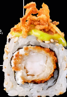
TIGER ROLL GUACAMOLE

● OPEN SUSHI: i piatti con questo simbolo sono inclusi nel menù open sushi; se il piatto non è incluso, è indicato il sovrapprezzo