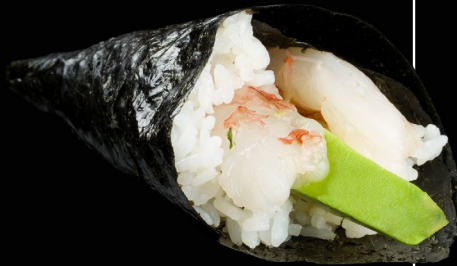
TEMA AMA EBI

TEMA VEGGIE (1 PZ) ● | ● alla carta € 3,00 Temaki di avocado, ananas e mango [311]