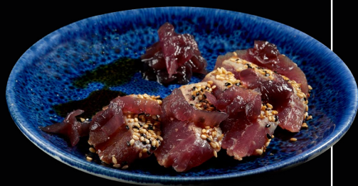
TONNO CON CIPOLLA ROSSA CAMELLATA

Tagliata di angus alla piastra in crosta di sesamo guarnito con cipolla rossa caramellata e salsa teriyaki [115]