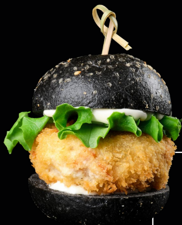
FISH BURGER SAKEFRIED