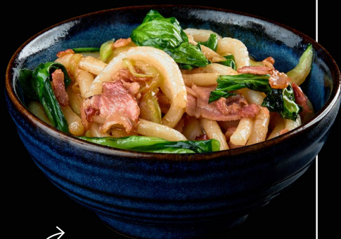
UDON AL WOK - PANCETTA E PAK-CHOI

● OPEN LUNCH: i piatti con questo simbolo sono inclusi nel menù open lunch; se il piatto non è incluso, è indicato il sovrapprezzo