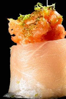
GU SPADA SAKE

GU AMA EBI (2 PZ) +€0,50 | +€0,50 alla carta € 4,00 Gunkan avvolto da alga yakinori con tartare di gambero, olio al dragoncello e ikura [288]