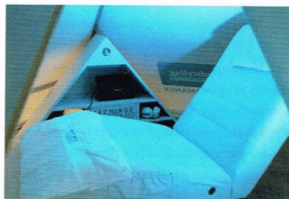
▲ MH Roadstyling maakte de piramide van tentdoek en stalen buizen en voorzag het van het logo.