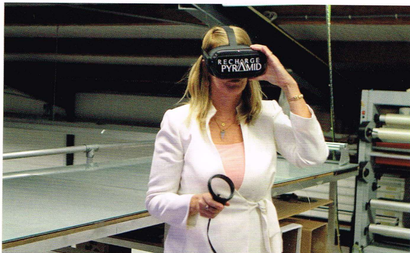
▲ Ook de VR-sessie is speciaal voor dit project ontwikkeld.