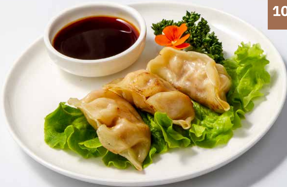
109 Gyoza teppanyaki 3pz. Ravioli di carne alla griglia