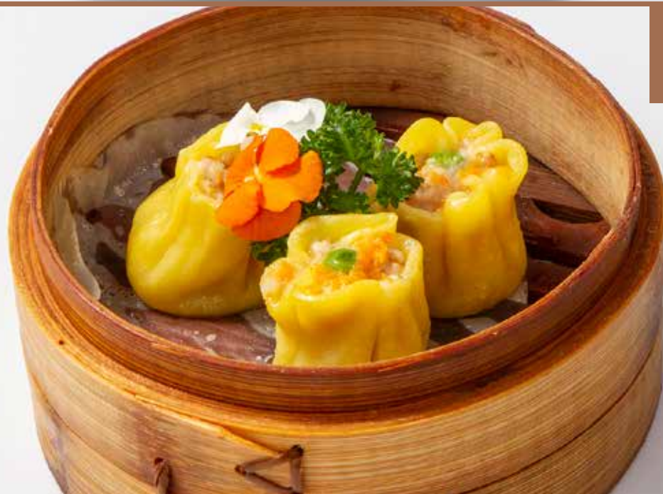
110 Shaomai 3pz. Ravioli di gamberi al vapore