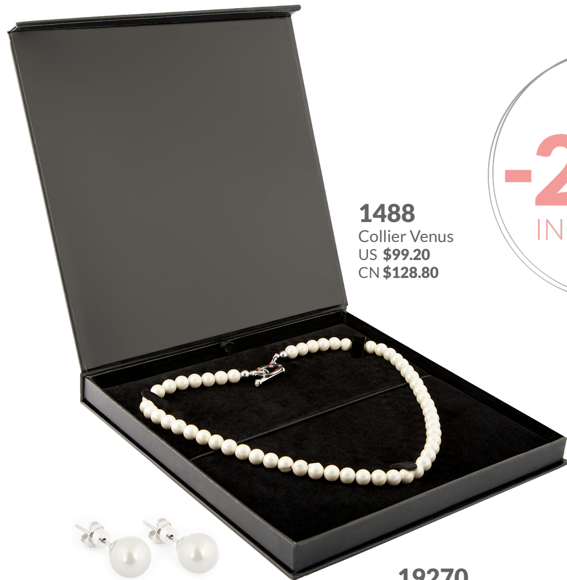
1488 Collier Venus US $99.20 CN $128.80