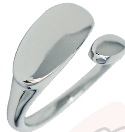
19161 Bague Kenko Nova ton Argent US $31.20 CN $40.00