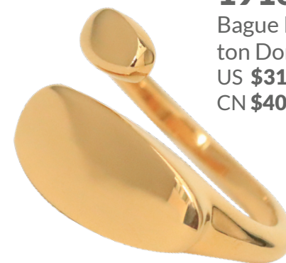
19162 Bague Kenko Nova ton Doré US $31.20 CN $40.00