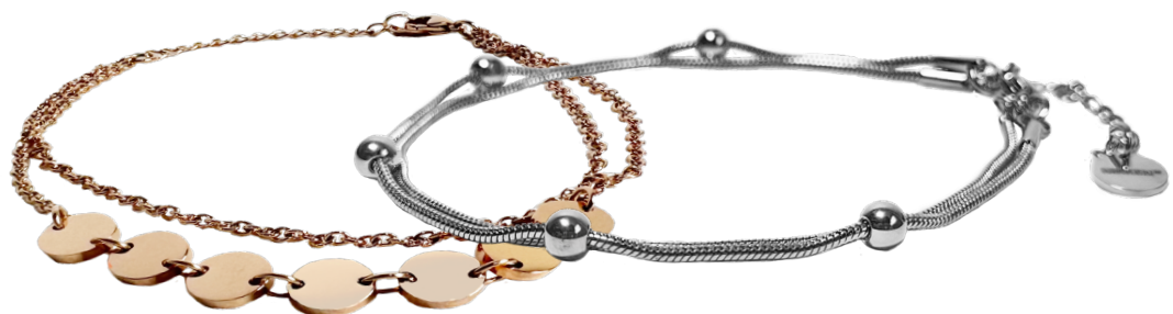
19277 Pulsera Universe Duo US $55.20 CN $72.00