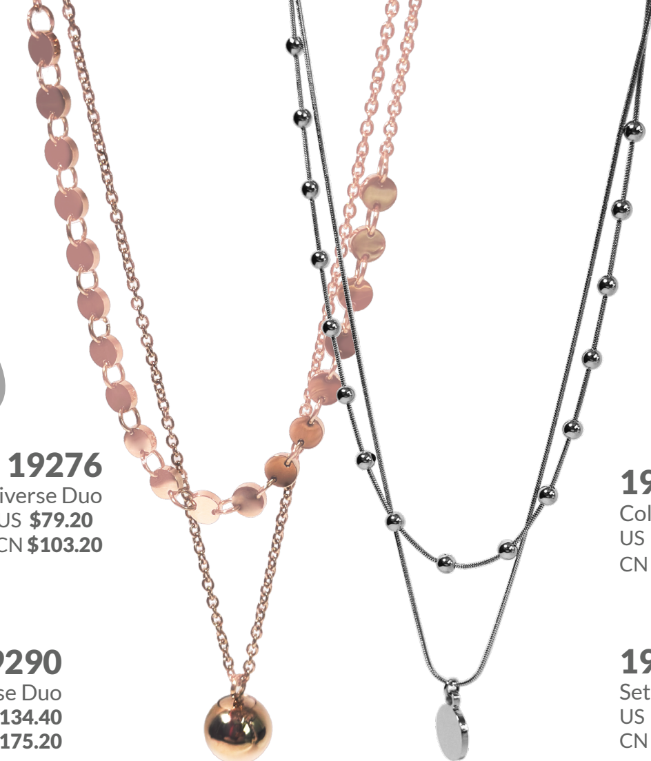
19276 Collar Universe Duo US $79.20 CN $103.20