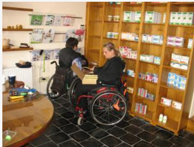
Přirozenou cestou s.r.o.

„Sociálním podnikání jsou podnikatelské aktivity prospívající společnosti a životnímu prostředí. Sociální podnikání hraje důležitou roli v místním rozvoji a často vytváří pracovní příležitosti pro osoby se zdravotním, sociálním nebo kulturním znevýhodněním. Zisk je z větší části použitý pro další rozvoj sociálního podniku. Pro sociální podnik je stejně důležité dosahování zisku jako zvýšení veřejného prospěchu.“ Zdroj: TESSEA