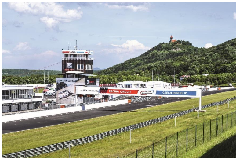
AUTODROM MOST a.s.

Autodrom Most byl vybudován v letech 1978 až 1983 v místě bývalého povrchového hnědouhelného dolu Vrbenský, a je tak ukázkou zdařilé revitalizace těžbou poškozené krajiny.