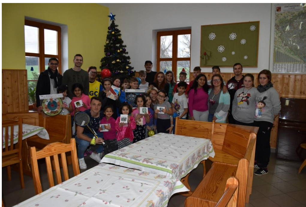
FK Teplice, a.s.

Strategický přístup klubu k CSR se projevuje ve všech oblastech řízení, od organizačních struktur způsob monitoringu a hodnocení CSR., až po transparentní komunikaci se všemi stakeholdery. Teplický klub se snaží nejen prostřednictvím své dlouhodobé komplexní angažovanosti v oblasti společenské odpovědnosti, ale též i příkladným fungováním ve všech dalších oblastech činnosti klubu, přispívat k pozitivnímu obrazu českého fotbalu. Zároveň by si management klubu přál, aby se jeho rozmanité CSR aktivity staly inspirací i pro další sportovní kluby a to nejen v Ústeckém kraji, ale v celé České republice.