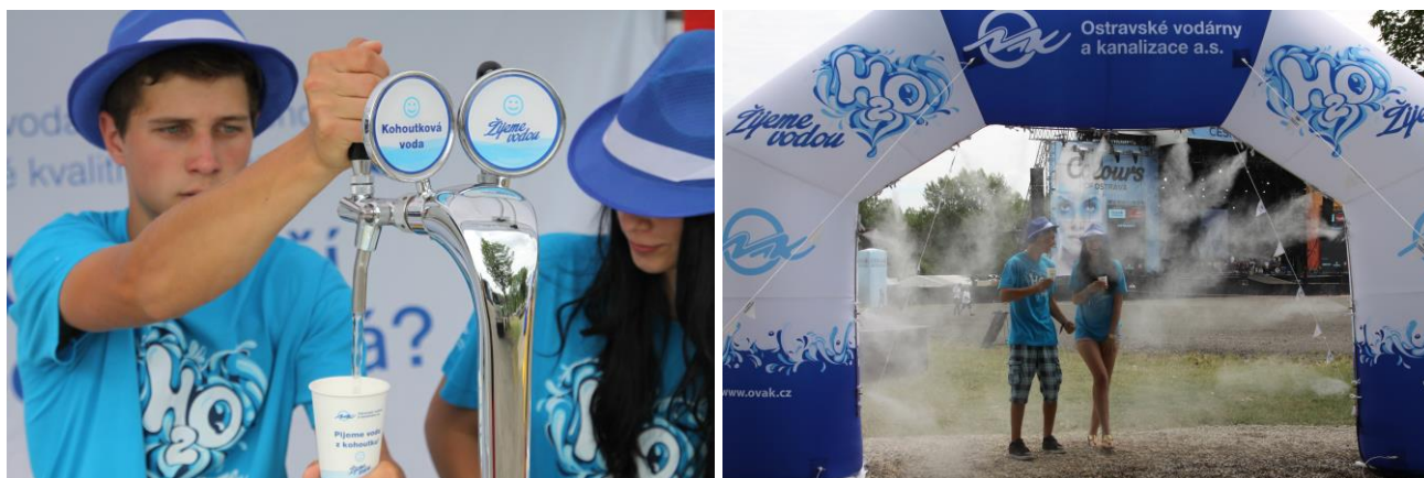
Ostravské vodárny a kanalizace a.s.

Společenskou odpovědnost vnímá OVAK, a.s. jako přirozenou součást každodenního života firmy a snaha v oblasti CSR byla oceněna i Cenou hejtmana Moravskoslezského kraje.