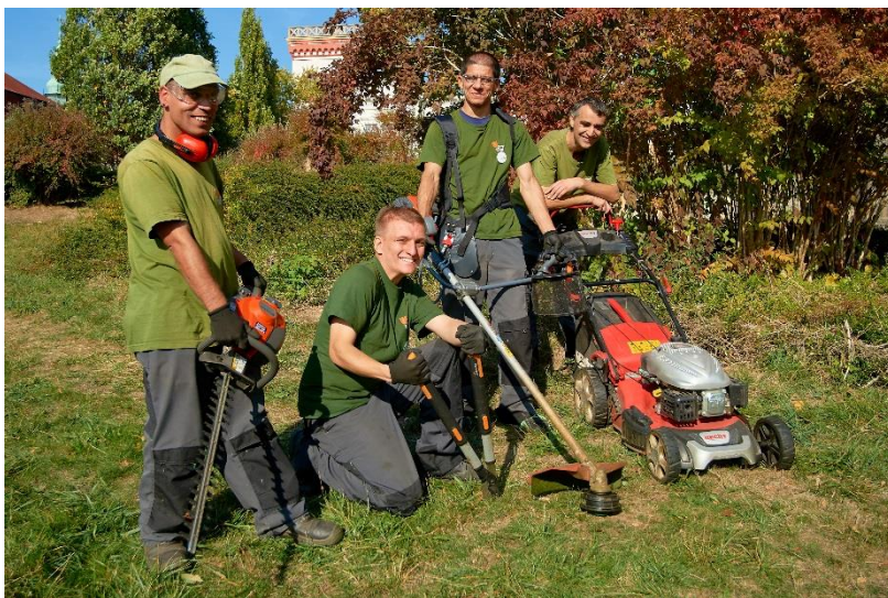
Sdružení TULIPAN, z.s.

Sdružení TULIPAN není v Liberci neviditelné, o jeho činnosti se zdejší obyvatelé dozvídají nejen z uvedených kulturních akcí, ale pravidelně se objevují na trzích se svým stánkem, kde nabízejí výrobky z chráněné dílny.