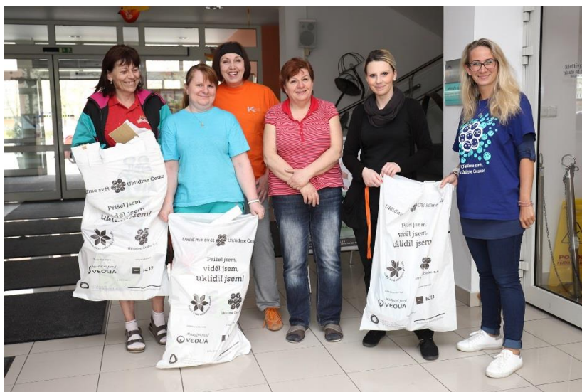
Kulturní zařízení Ostrava-Jih

Nejdůležitější je však skutečnost, že lidé v Kulturním zařízení Ostrava-Jih jsou si vědomi toho, jak klíčové je v současném světě vědět, že společenská odpovědnost nejsou jen prázdná slova. Že je podstatné žít, pracovat a myslet v souladu se společenskou odpovědností a šířit ji kolem sebe svým každodenním chováním a osobním postojem.