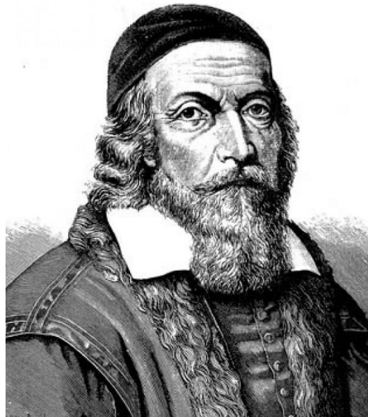
Jan Ámos Komenský

„Posláním vzdělávání od začátku do konce budiž hledati a nalézati způsob, který by umožnil, aby učitelé méně učili, žáci se však více naučili, aby ve školách neměl místa křik, pocit ošklivosti, vědomí marné práce.“