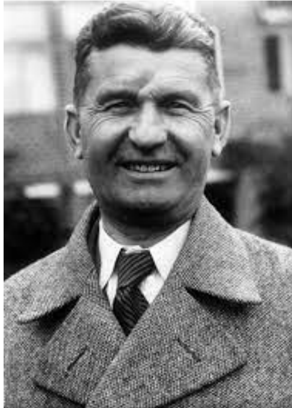
Tomáš Baťa (1876 – 1932)

„Neříkej, že to nejde, raději řekni, že to zatím neumíš.“