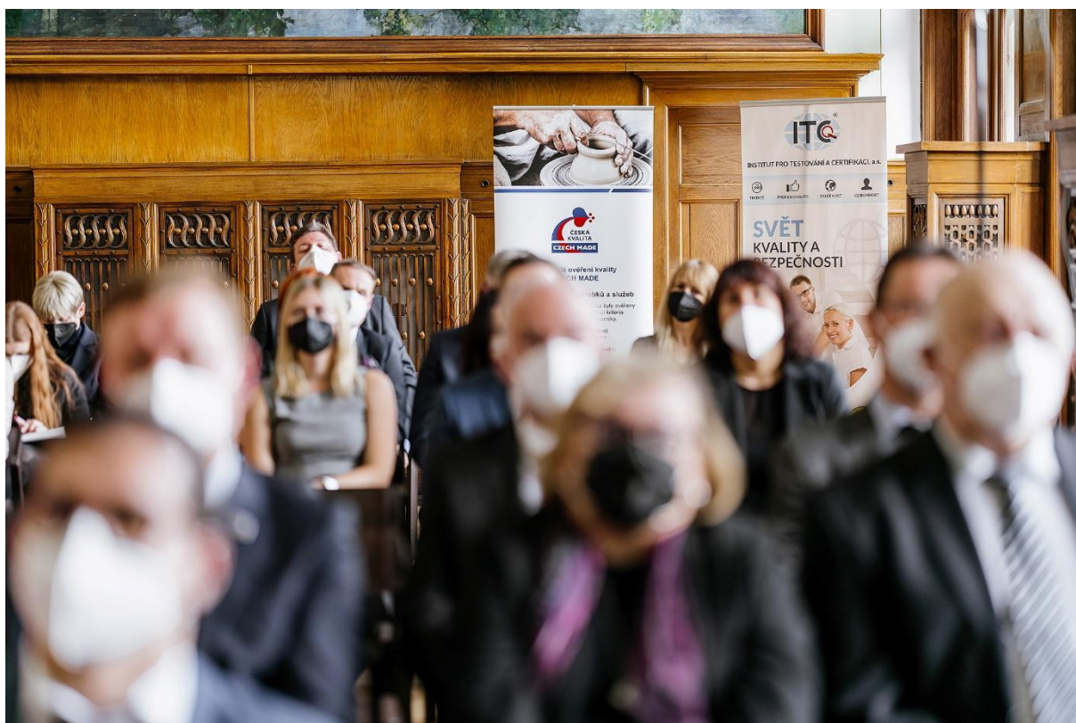
Den s Českou kvalitou – 3. listopadu 2021