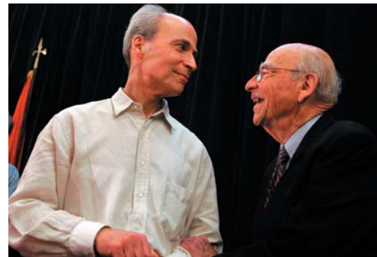
スタンフォード大学（米）のロジャー・コーンバーク教授（左、59歳）と、その父親で同大学名誉教授のアーサー・コーンバーク（右、88歳）。

でもあるJudith Howardは、今回の受賞に感激してこう語る。「生体内作用がどのように機能しているかを理解するために、この美しく、そして静的な情報を集めるという彼の研究が認められたことは、本当に素晴らしいことだ」。