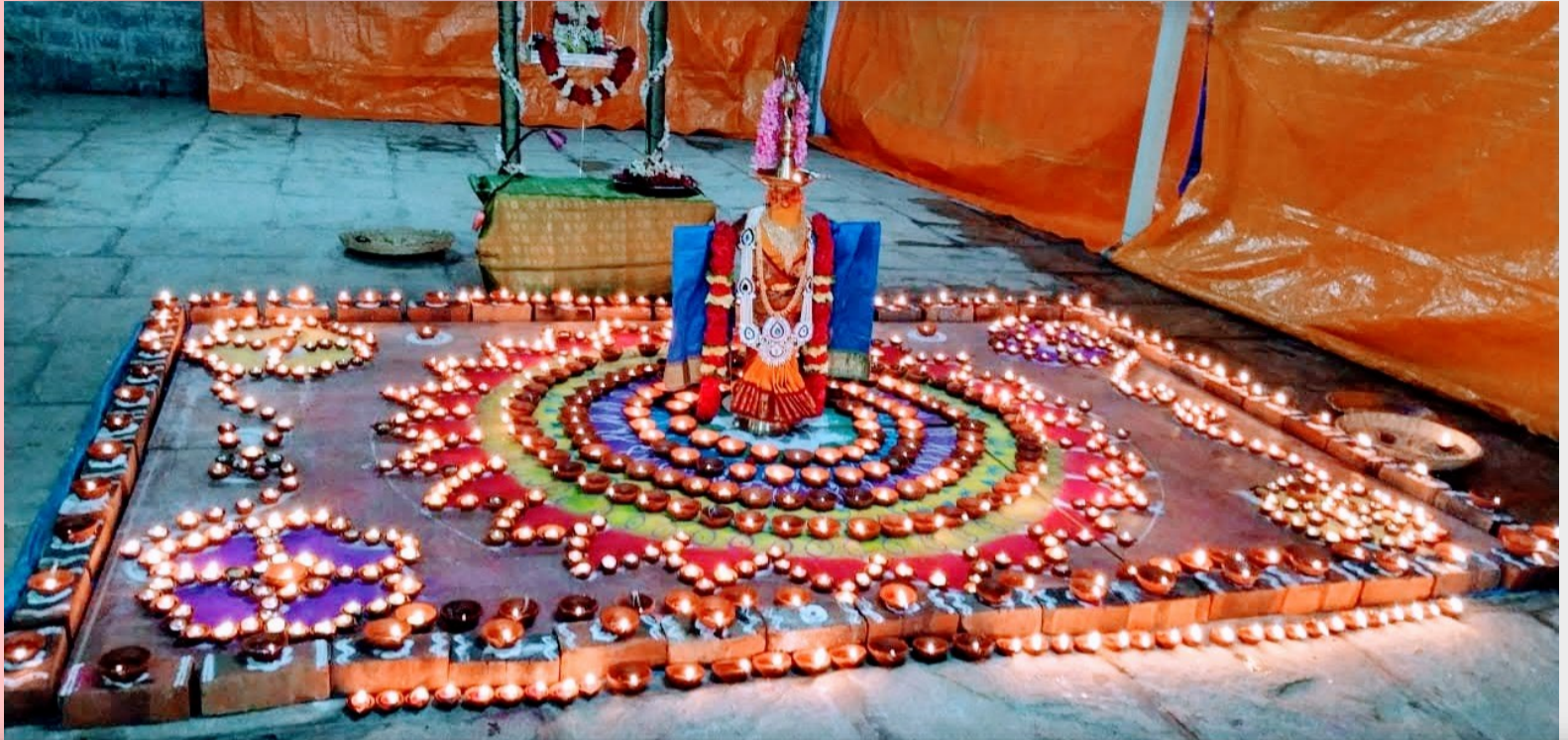
Above : Array of lamps on a bed of colourful rangoli for Sri Bala, seated on a decorated oonjal during Karthigai deepam.