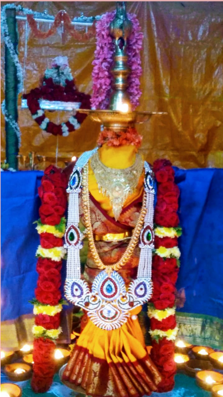
Below: Ambal decked in velli kavacham after Maha Abhishekam