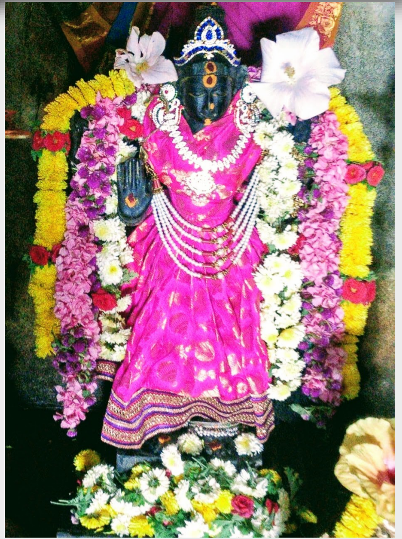
All: The different alankarams of the Raja Bala at the temple this month