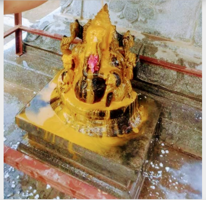
Sandhanam Abhishekam for all deities during Margazhi Maasa Pirappu