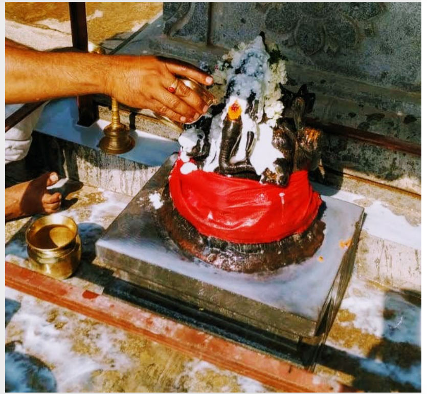
Above: Paal abhishekam for Siddhi Vinayagar