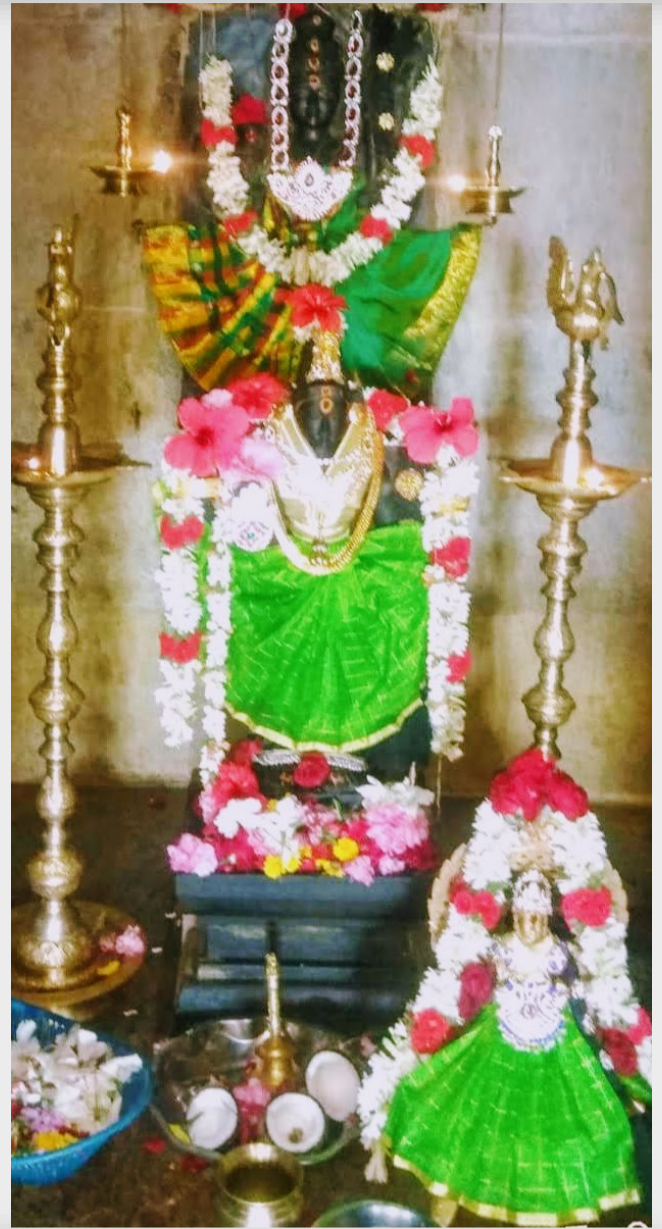
All: Raja Bala, Kutti Bala and Rajarajeshwari Ambal looking radiant in matching green and cream paavadais with beautiful jewels and flowers.