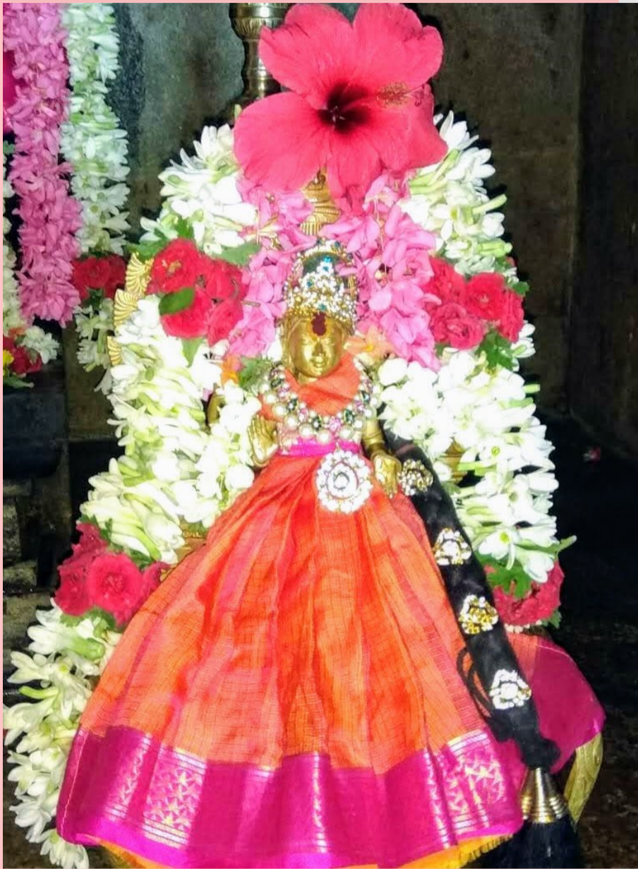
Above & Right: Kutti Bala looking cherubic, adorned in jewels and in light pink and orange paavadais during daily alankarams