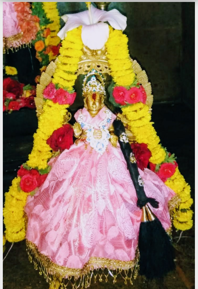
Left: Raja Bala Thiruvadi alankaram adorned with flowers and manjal kumkum