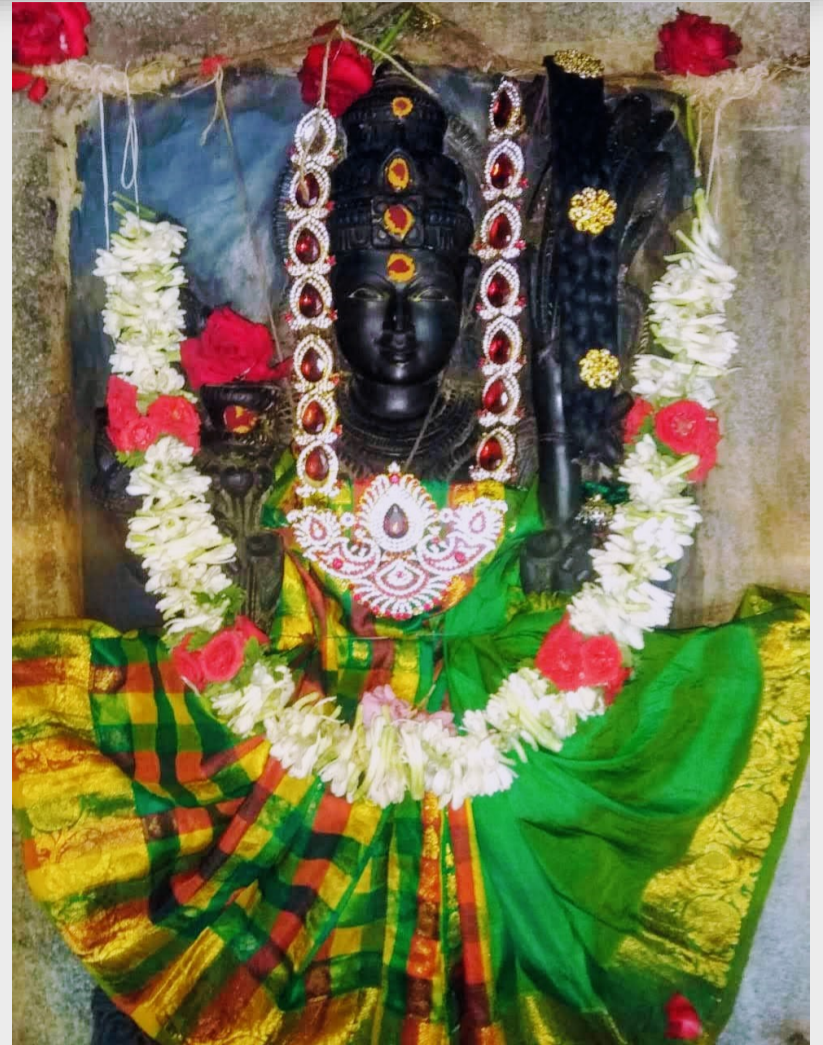
All: The various alankarams of Sri Rajajeshwari