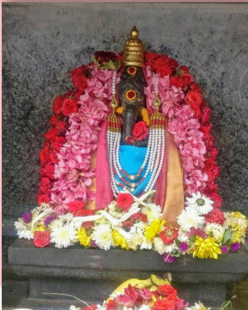
Below: Vinayagar flower alankaram after abhishekam.