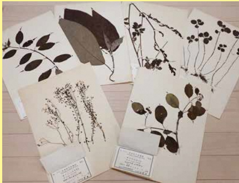
鑑定者 理博牧野富太郎 植物標本 (当館所蔵)

日本で見られる1500種類余りの植物の「名付け親」、牧野富太郎博士。日本のすべての植物を知りたいという夢と、ただただ「植物が好き」という純粋な気持ちを原動力に、日本の近代植物学の基礎を築くとともに、生涯、植物を記録する地道な活動を続けました。