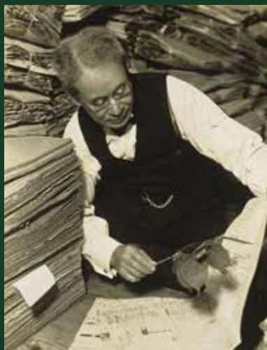
自宅の標本室で