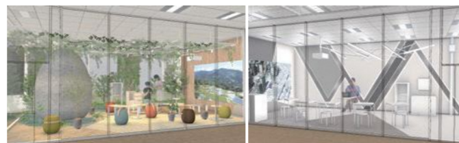
*画像は完成イメージCGです。