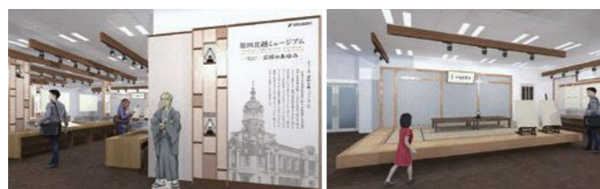
*画像は完成イメージCGです。