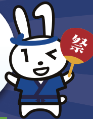
マイナンバーカードPRキャラクター マイナちゃん