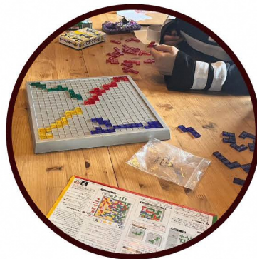
みんなで一緒にあそぼう