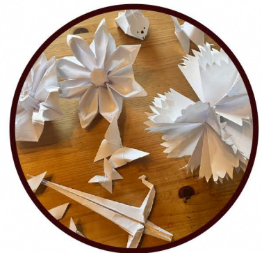
お絵かきや工作もできる!