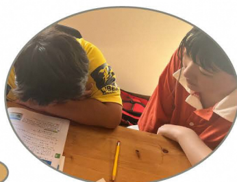
大学生が優しく勉強をおしえてくれるよ!

場所 米百俵プレイスミライエ長岡 4階 ミライエステップ (1/13(土)) 3階 ミライエハウス (1/28(日)) (〒940-0062 長岡市大手通2-3-10)