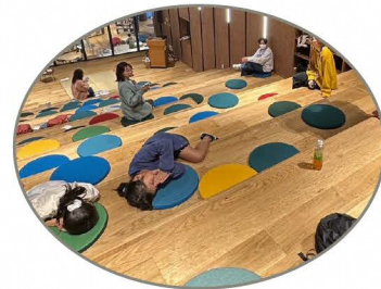
好きな時間に来て 好きな時間に帰れるよ!