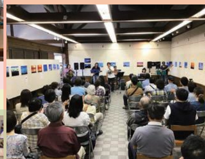
ホールではコンサートもできます