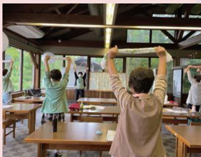
明るい光が差し込むテーブル席