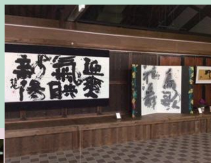
昔ながらの板戸を活かした ギャラリースペース