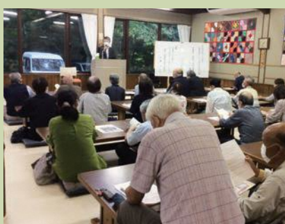
和室はひろびろ 40 畳