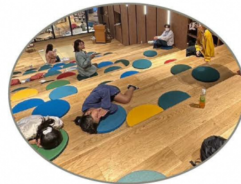
好きな時間に来て好きな時間に帰れるよ!