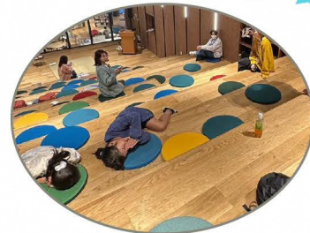
好きな時間に来て 好きな時間に帰れるよ!