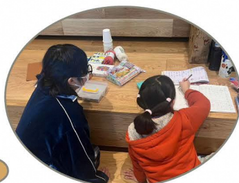
大学生が優しく勉強をおしえてくれるよ!