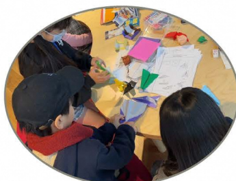
気分転換にお絵かきや工作、カードゲームもできるよ!