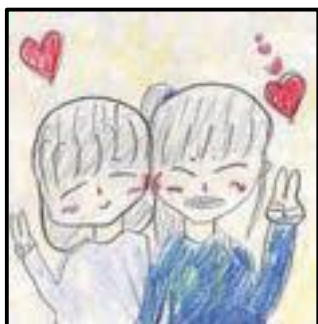
大島小4年 りんごさん