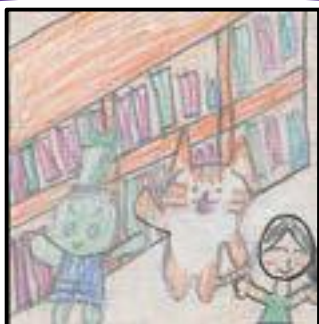
富曾亀小6年 マユマユさん